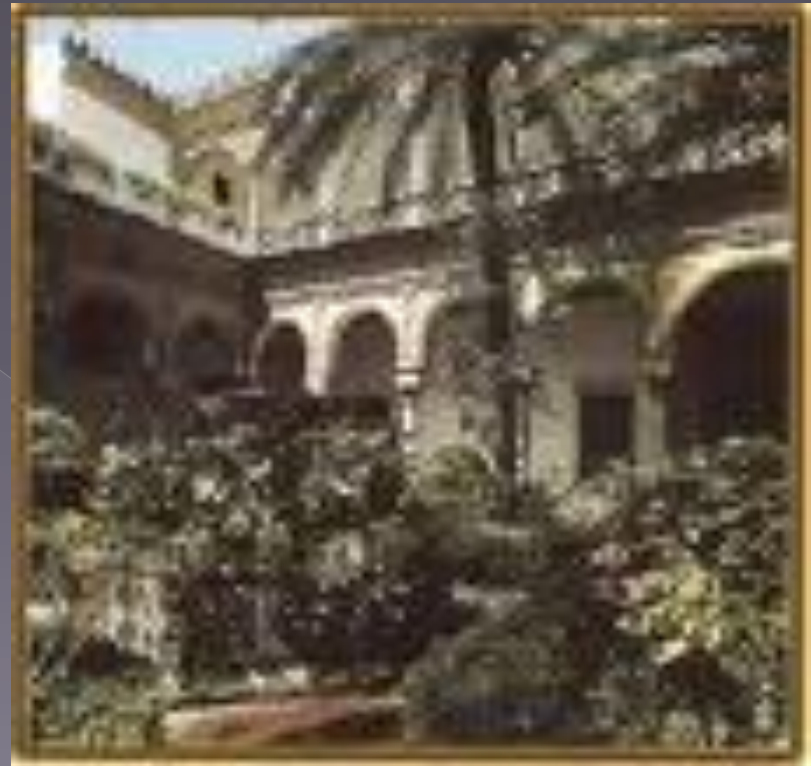
Lugar donde nació Machado